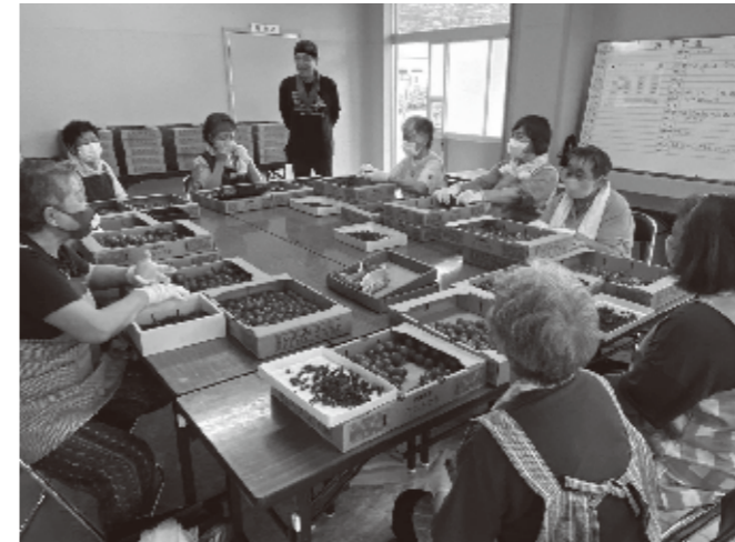
7/1 農福連携「集いのトマト」 令和7年6月4日から10月31日までの5か月の期間で、 集う楽しみをもってミニトマトのヘタ取り作業を行う 「集いのトマト」が開始されました。