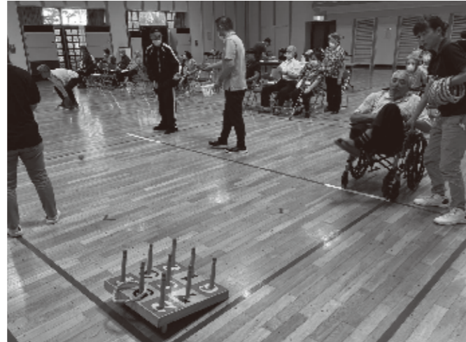
9/26 東津軽郡障害者レクリエーションの集い 平内町において、東津軽郡4町村による レクリエーションの集いに参加しました。