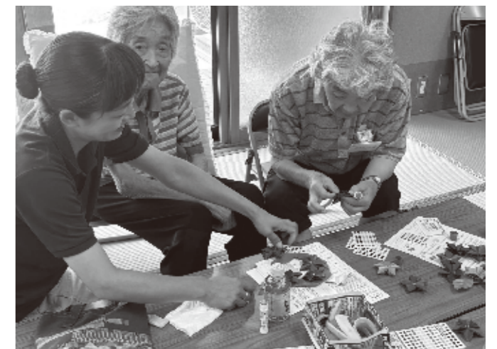
9/5 ひとり暮らし昼食会 よもぎ温泉大広間において、見守り登録のされている 75歳以上の方が集い昼食会が行われました。