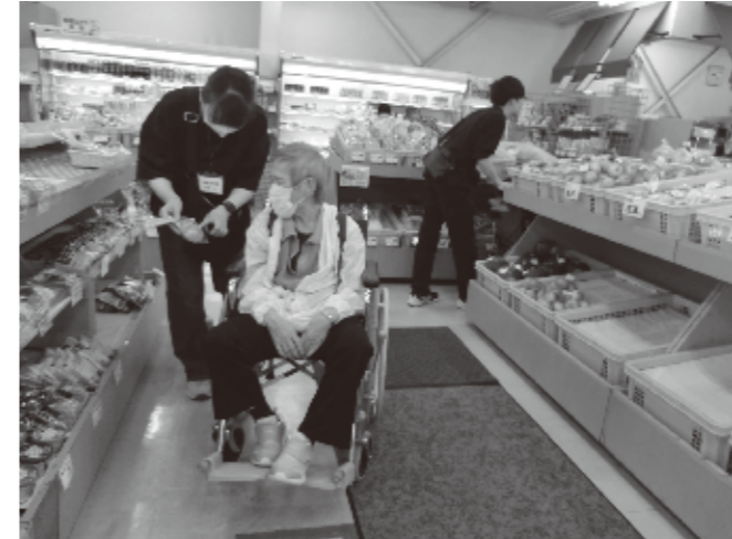
6/10 蓬田村身体障害者買い物リハビリ 青森市東バイパスラ・セラにおいて、 買い物と昼食を楽しみました。