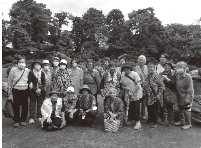
9/17 蓬田村母子寡婦福祉交流会 外ヶ浜町母子寡婦福祉会との交流を目的に 黒石市「金平成園」を訪問しました。