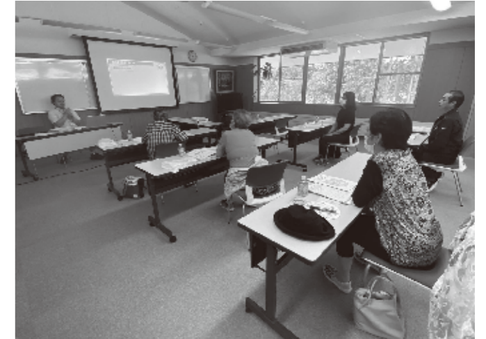
6/30 令和7年度第1回ボランティア養成研修 蓬田村ふるさと総合センターにおいて、 新たにボランティア活動に参加する方を対象に ボランティア養成研修を開催しました。