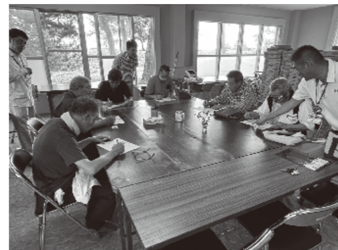
8/26 たすけあい交通安全運転講習 安全運転行動の体得と事故防止を目的に 青森モータースクールから講師をお迎えして 運転適性検査とディスカッションを行いました。